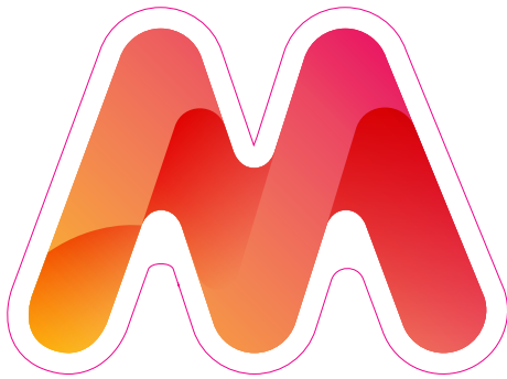
CMYK painatus ja leikkauslinja

HUOM! Pienin käytettävissä oleva magneetin halkaisija on 15mm (pyöreä). Lopullisen tuotteen kapein kohta tulisi siis olla vähintään 20mm jotta magneetti ei näy puun takaa.