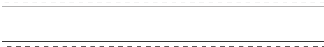
Esim 140 x 15mm Aineisto 140 x 19mm

Keräysnauhojen pakkaaminen on yksi tuotteen suuritöisimmistä työvaiheista. Koska nauhat pyritään pakkaamaan nopeasti, nauhojen kiinnitys hakaneulaan vaihtelee tekijän mukaan. Kiinnityskohtaa ei voi määrittellä millimetrin tarkkuudella, kiinnityskohta vaihtelee. Koska käyttäjä avaa neulan kiinnittääkseen nauhan, ei kiinnityskohta ole pakkauksessa lopullinen.